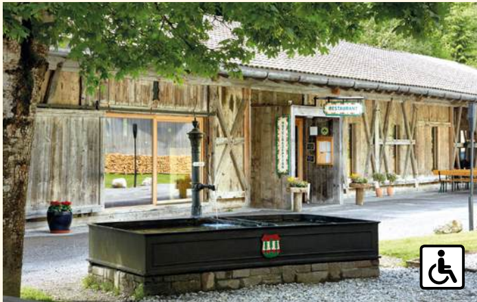
Salzstadl – ein Zeitzeuge des Salzhandels, heute Restaurant