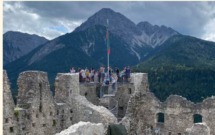
Kernburg mit Torhalle und Aussichtsplattform am Dürnitz