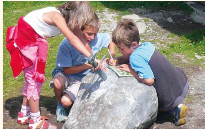
Spannende Schatzsuchen: Lesen – Staunen – Aufkleben – Entdecken