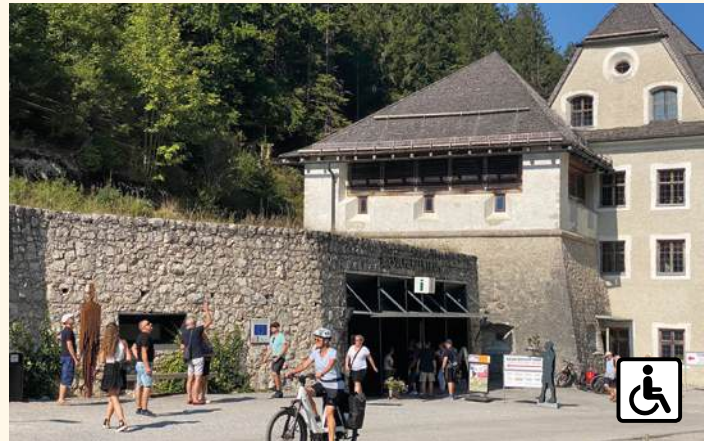
Besucherzentrum, Eingang zum Museum, Klaus Ehrenberg