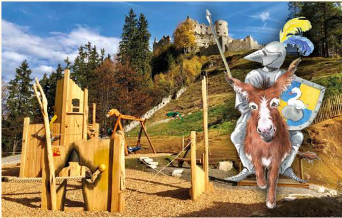
Ritter Rüdiger Abenteuerspielplatz