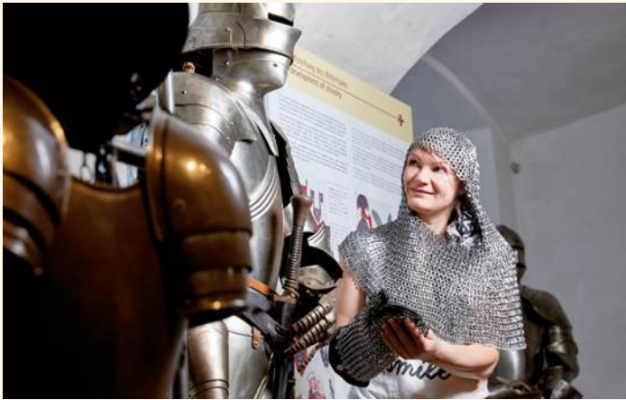
Selber das Gewicht einer Rüstung spüren