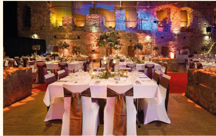
Die Klaus-Arena bietet Platz für bis zu 400 Personen